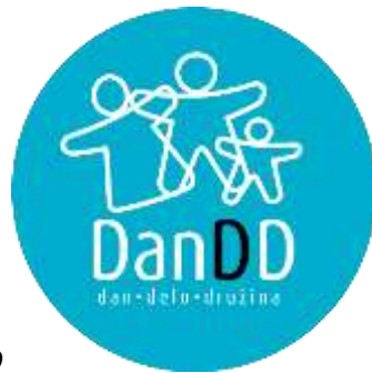
Logo Dneva DD