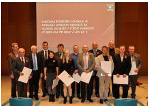
Dobitniki nagrad in priznanj Avgusta Kuharja v letu 2015 po podelitvi